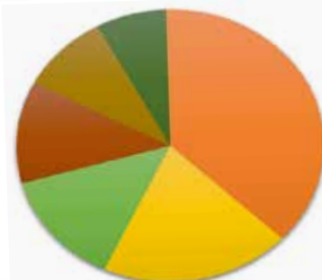
Hvad gav vi tilskud til?