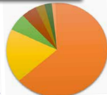
Hvor kom pengene fra?