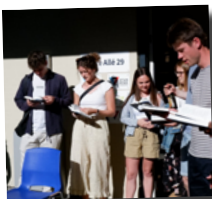
Forsidefoto: Mosaik på træbogstaver fra et kursus på Børnehøjskolen