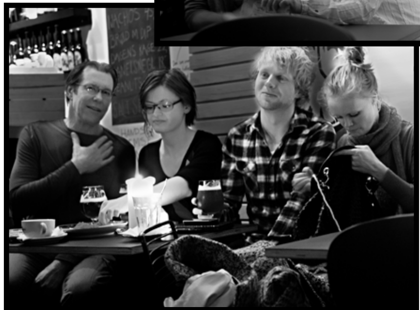
fairbar 2009