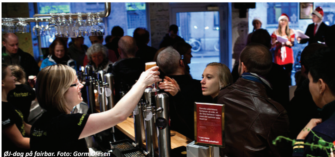
ØJ-dag på fairbar.

2011 har på den økonomiske side været en større udfordring end 2010. Selvom effektiviteten i cafédriften overordnet har været den samme, har vi oplevet en lavere omsætning i 2011.