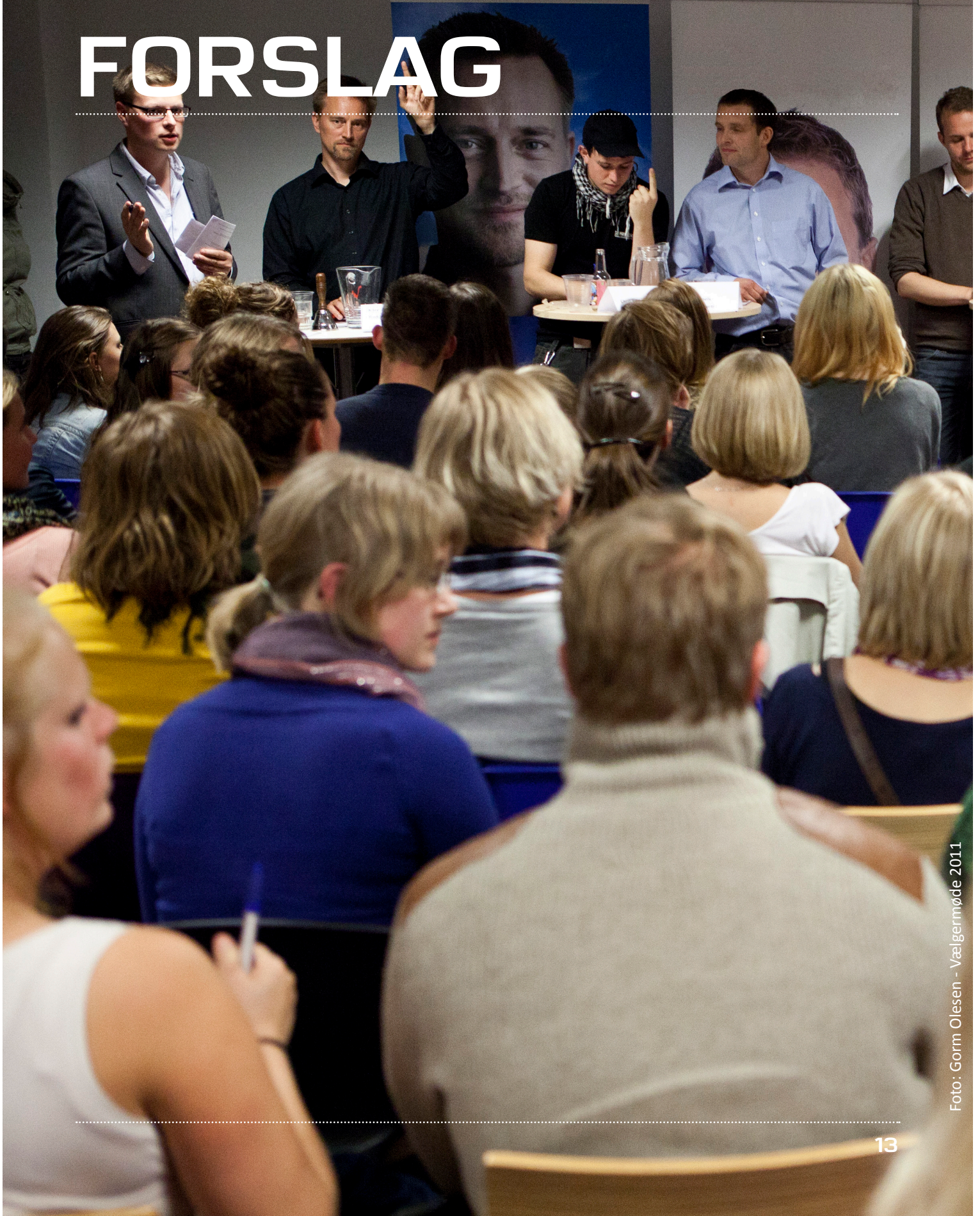
Vælgermøde 2011