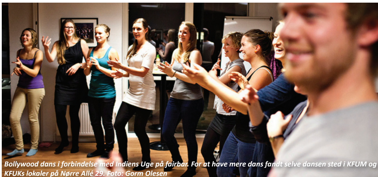
Bollywood dans i forbindelse med Indiens Uge på fairbar. For at have mere dans fandt selve dansen sted i KFUM og KFUKs lokaler på Nørre Allé 29.