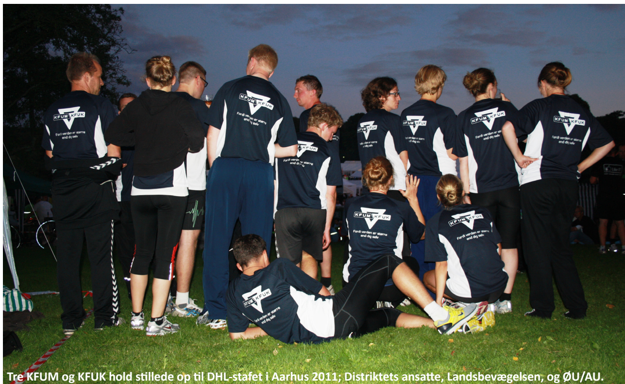
Tre KFUM og KFUK hold stillede op til DHL-stafet i Aarhus 2011; Distriktets ansatte, Landsbevægelsen, og ØU/AU.