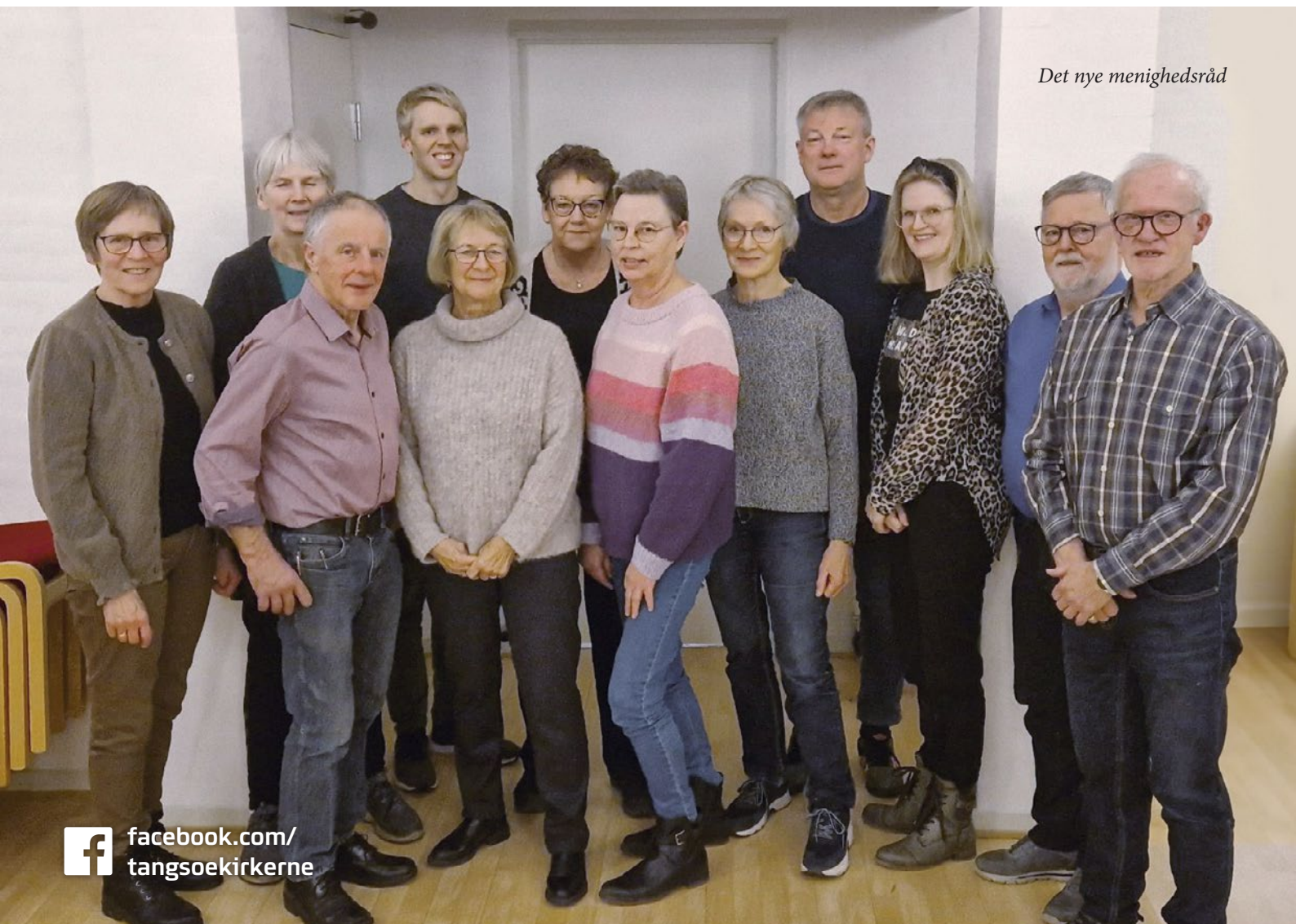
Det nye menighedsråd