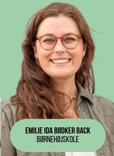
EMILIE IDA BØDKER BACK BØRNEHØJSKOLE