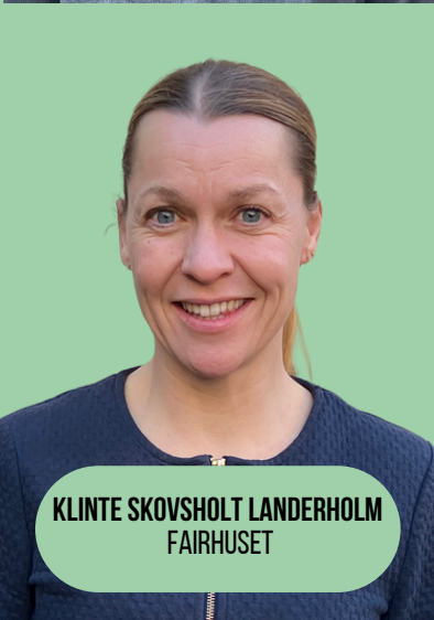
KLINTE SKOVSHOLT LANDERHOLM FAIRHUSET

ANSATTE I DISTRIKT AARHUS Vi er de ansatte kræfter bag Distrikt Aarhus. Tøv ikke med at skrive til os. Du finder vores kontaktoplysninger på kfum-kfuk.dk/ansatte