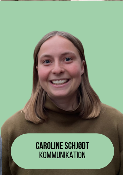
CAROLINE SCHJØDT KOMMUNIKATION