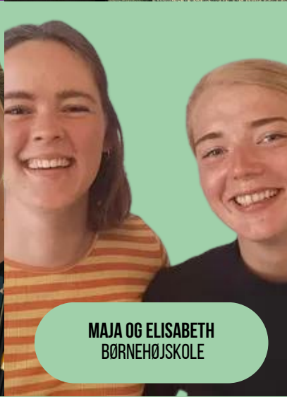
MAJA OG ELISABETH BØRNEHØJSKOLE