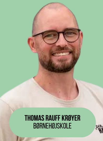
THOMAS RAUFF KRØYER BØRNEHØJSKOLE